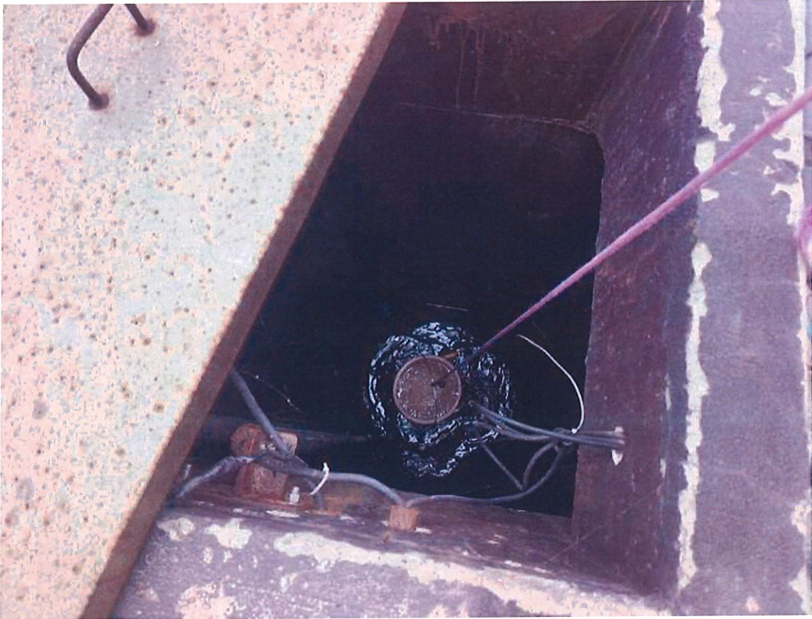
渗滤液处理站出口 ***报告结束***