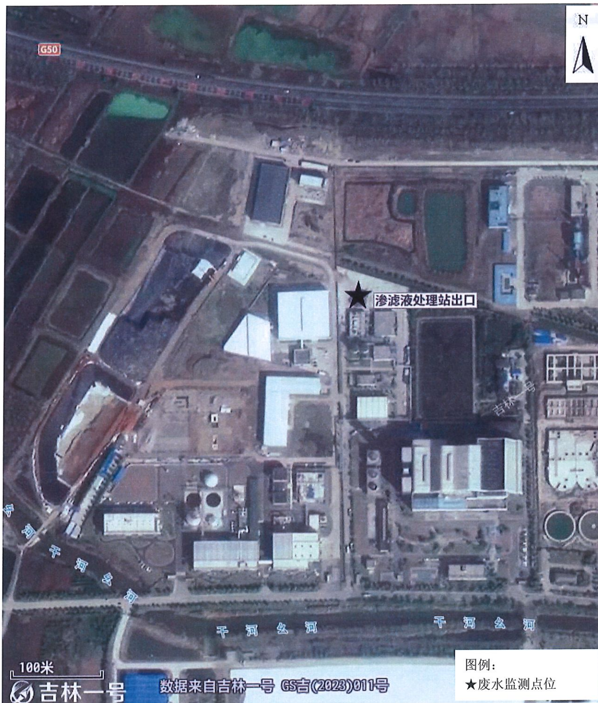
附图 1：监测点位示意图