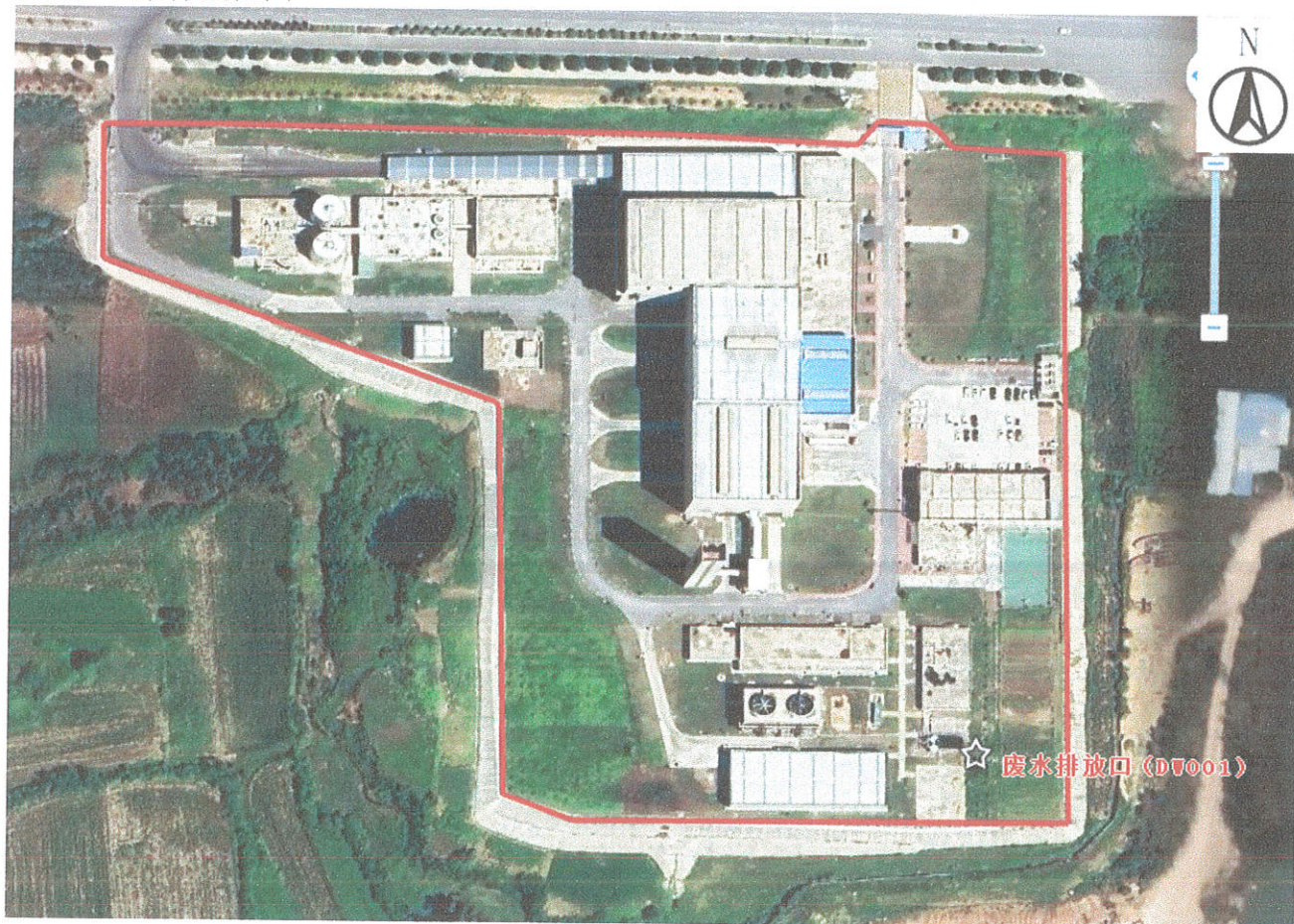
附件 2: 采样点位图