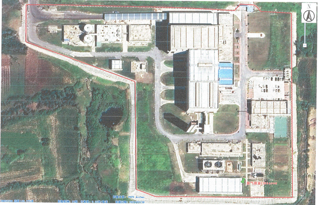
附件 2: 采样点位图